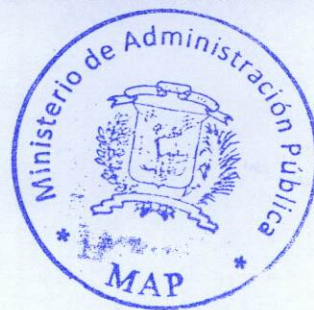
Lic. Ramón Ventura Camejo Ministro de Administración Pública.

DADA: En la ciudad de Santo Domingo, Distrito Nacional, República Dominicana, a los veinticinco (25) días del mes de Julio del año dos mil trece (2013).