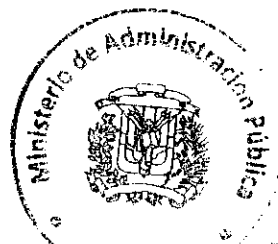
Ramón Ventura Camejo Ministro de Administración Pública