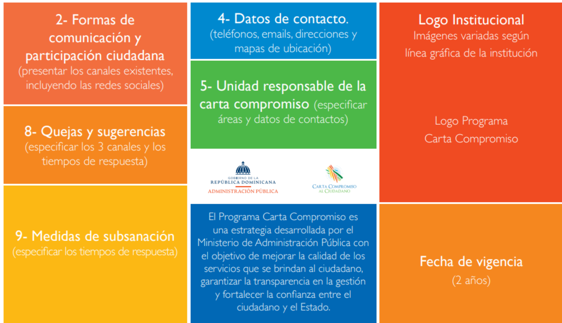
Gráfico 01. Cara externa brochure Carta Compromiso al Ciudadano