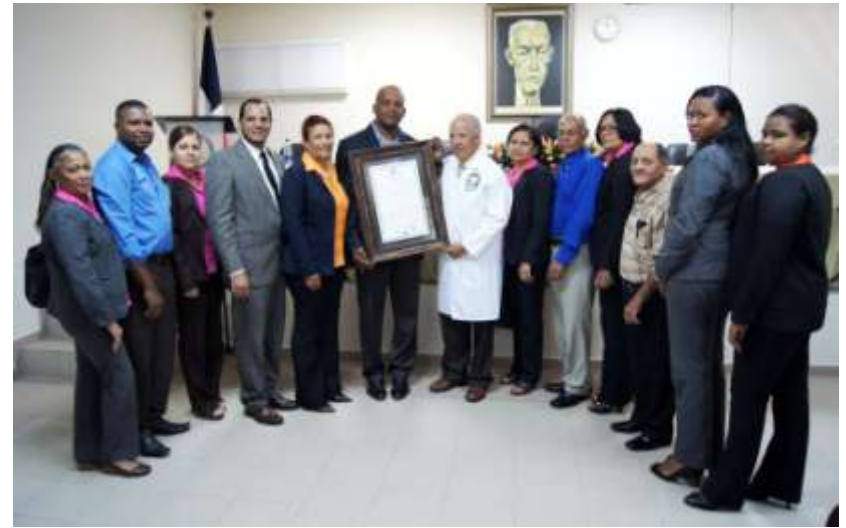
Ayuntamiento de Rincon