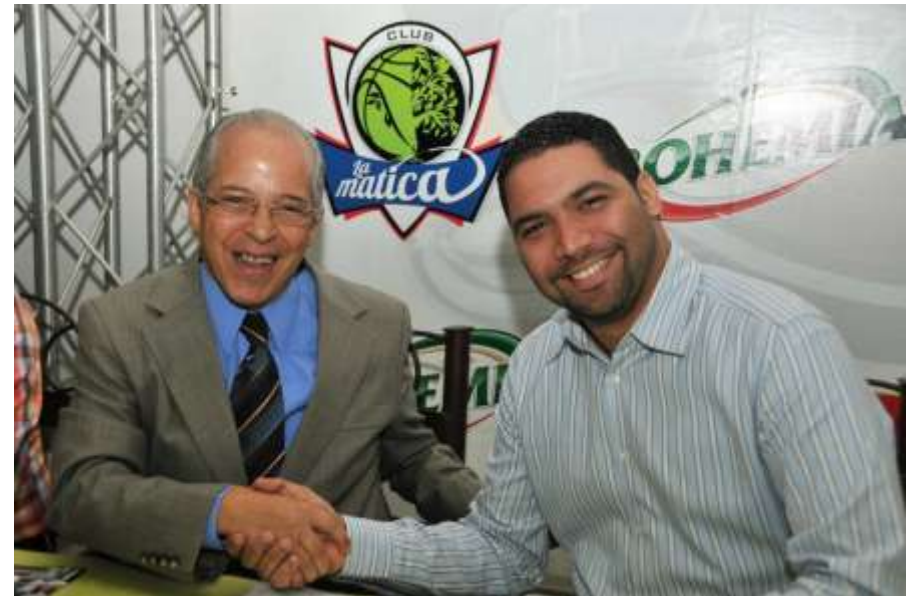
Asociación de Baloncesto Vegano