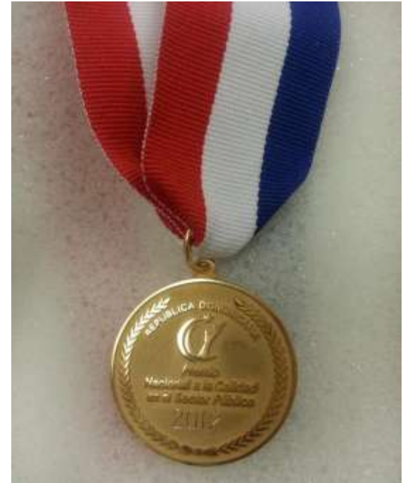
Medalla de Oro 2012