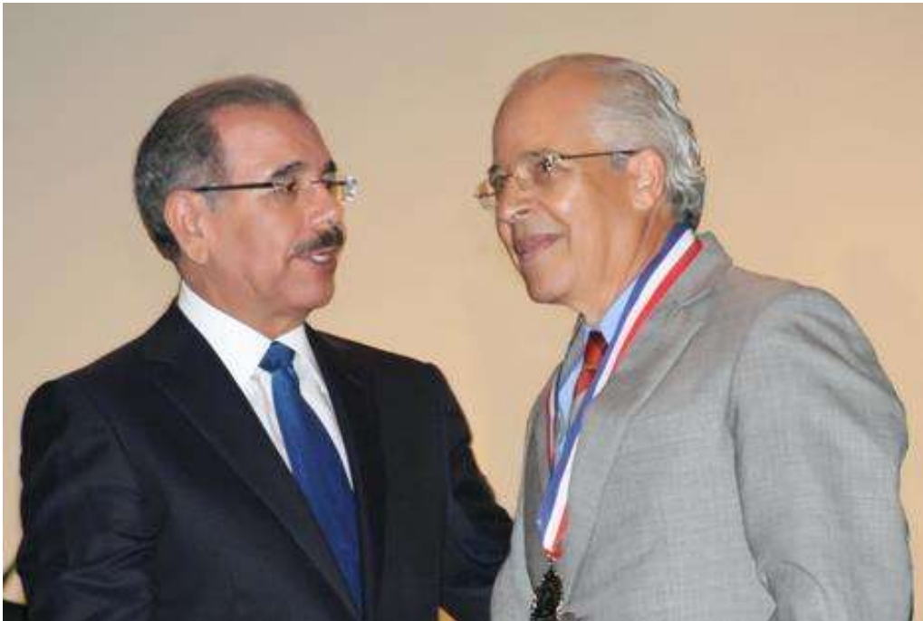
Medalla de Oro a la Calidad y Practicas Promisorias 2012