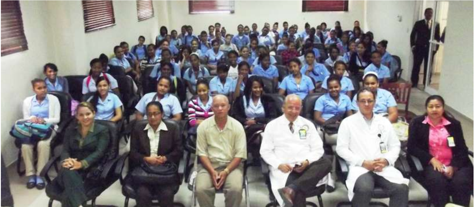
Liceo Don Pepe Álvarez