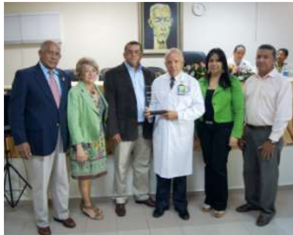
Asociación Para el Desarrollo de la Provincia de La Vega