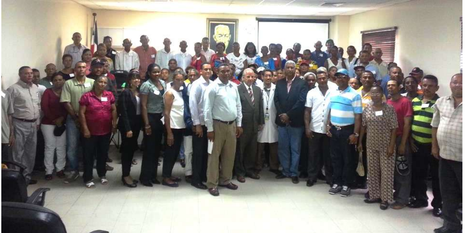
Ayuntamiento de de Jima