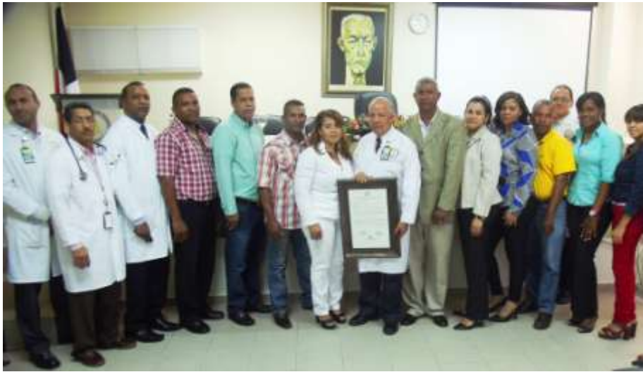
Ayuntamiento de Jima